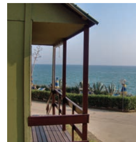
BELVEDERE min. 2 - max 3 pers

SUPPLEMENTI E RIDUZIONI - Bambini 0-3 anni gratuiti; 4-11 anni tariffa bambino aggiunto; da 12 anni tariffa persona aggiunta; culla €5,00 p.n. Ristorante: Mezza pensione € 30,00 p.p.; Pensione completa € 40,00 p.p. (colazione all'italiana) Bevanda escluse. Pulizia Finale € 50,00 da saldare all'arrivo. Una pulizia infrasettimanale; Martedì per arrivi sabato - mercoledì per arrivi domenica. Cambio asciugamani incluso. Pulizia Weekend € 35,00 (€ 20 monolocale) Piscina Apertura 13 maggio-15 Settembre supplemento di € 6,00 p.p.. Ospiti: da registrare al ricevimento - 2 ore gratuiti tariffa dopo le 2 ore € 10,00 p.p.. Tassa di soggiorno da saldare all'arrivo € 1,00 dai 16 anni compiuti in poi (e secondo disposizioni comunali). Parcheggio gratuito nelle apposite aree. Pulizia extra € 40,00. Biancheria letto cambio € 5,00 p.p.: Asciugamani € 5,00 p.p.. Uscita dopo le 10:00 am (su disponibilità) € 25,00.